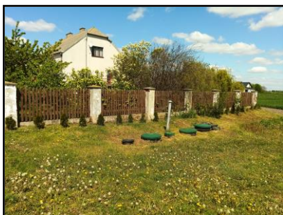
Instalacja do zasilania budynku mieszkalnego