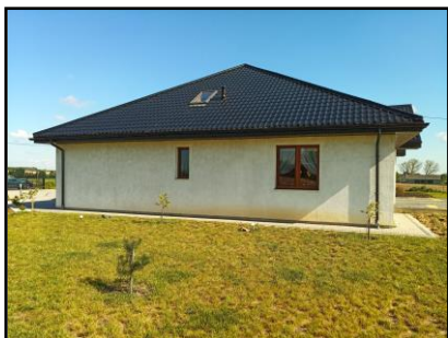
Instalacja do zasilania budynku mieszkalnego