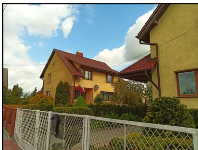
Instalacja do zasilania budynku mieszkalnego