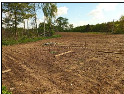
Instalacja do zasilania budynku mieszkalnego