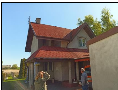
Instalacja do zasilania budynku mieszkalnego