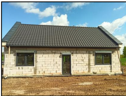
Instalacja do zasilania budynku mieszkalnego