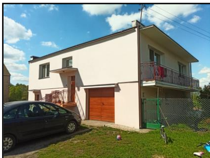
Instalacja do zasilania budynku mieszkalnego