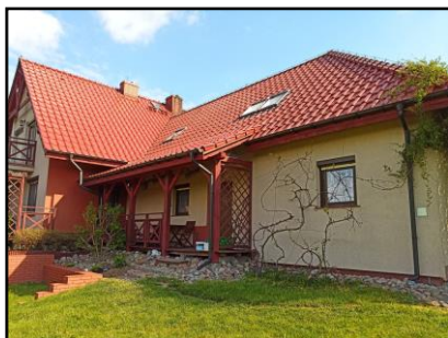
Instalacja do zasilania budynku mieszkalnego