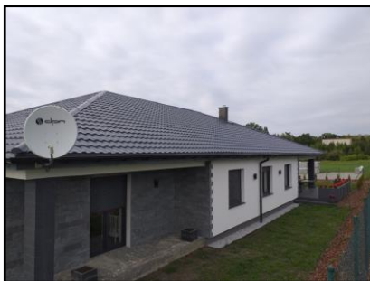
Instalacja do zasilania budynku mieszkalnego