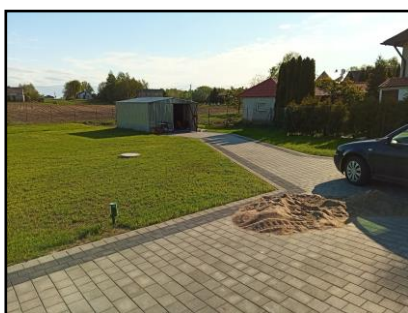
Instalacja do zasilania budynku mieszkalnego