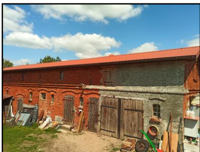
Instalacja do zasilania budynku mieszkalnego