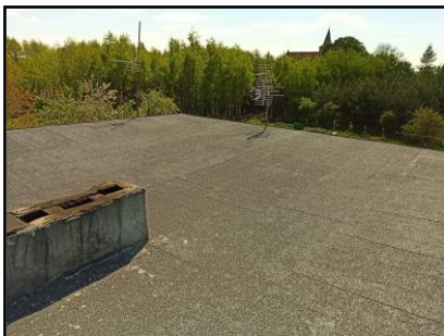
Instalacja do zasilania budynku mieszkalnego