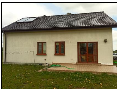
Instalacja do zasilania budynku mieszkalnego