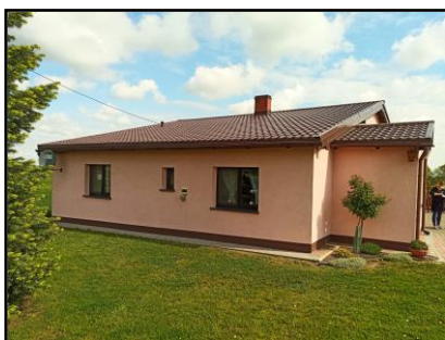
Instalacja do zasilania budynku mieszkalnego