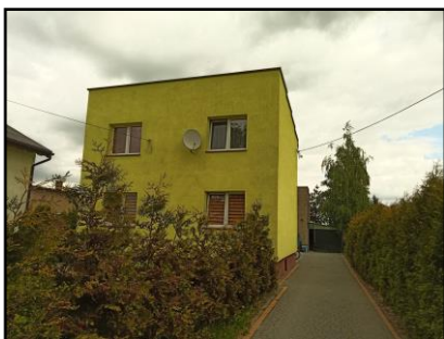
Instalacja do zasilania budynku mieszkalnego