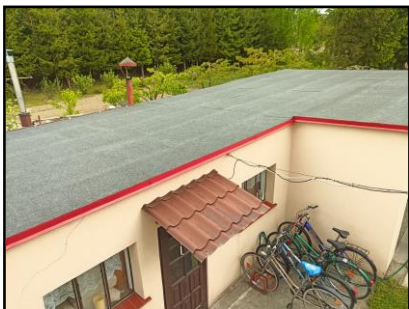
Instalacja do zasilania budynku mieszkalnego