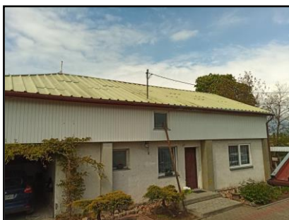
Instalacja do zasilania budynku mieszkalnego