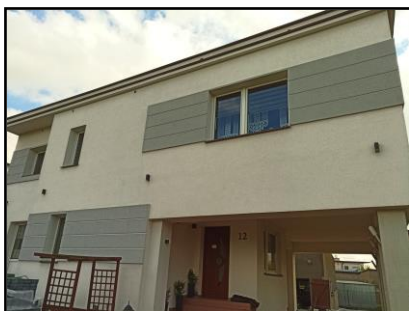
Instalacja do zasilania budynku mieszkalnego