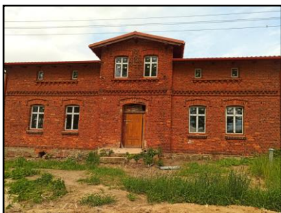
Instalacja do zasilania budynku mieszkalnego