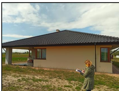
Instalacja do zasilania budynku mieszkalnego